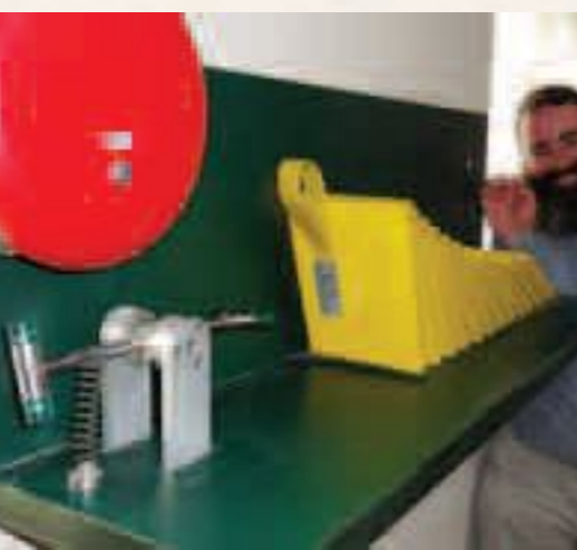
'גרמא': הדגמה באמצעות 'אפקט הרומינו', כשהאבן האחרונה נופלת על מכשיר חשמלי ומדליקה אותו.