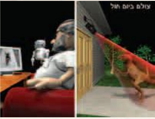
צולם ביום חול

הכנסת רוח חיים במערכת, מה שאין כן בסגירת דלת. ולגבי איסור ההבערה - בסיוור מוסבר שהיבטים מסוימים של השימוש בחשמל עלולים להיות אסורים משום הבערה, בעוד שבהיבטים אחרים איסור זה לא קיים. החלוקת נורת להט דינה כהבערה, וכדי להמחיש זאת משתמשים במכון 'נורת אדיסון', נורת להט שבה החוט עבה יותר מאשר בנורות המוכרות לנו, מהסוג שבו השתמש אדיסון כשהמציא את הנורה החשמלית. נורה זו מאפשרת להבין טוב יותר את איסור ההבערה שיש בהדלקת נורת להט. אגב, רבים טועים לחשוב שבהדלקת נורת פלורסנט ארוכה אין משום הבערה, אולם מארנץ מחדש (גם לי) שלא כך. אמנם בעצם הארת הפלורסנט אין איסור הבערה (מפני שהאור נוצר כתוצאה מגז ניאון הנמצא בתוך הנורה, שהזרם החשמלי העובר דרכו גורם לפליטת פוטונים שבשעת פגיעתם בדפנות מביאות לפליטת פוטונים). אולם כשנורה כזו נכנסת לתוך חללית המכונה 'חללית חשמלית' (אם כי בהחלטה של הנהלת המכון) היא נחשבת כחשמלית. לא הצלחנו להתחקי. גם מצלמות אבטחה פועלות על שינוי זרם. השימוש הנרחב במחשבים לצורכי ביטחון הביא את צומת לפתח מקלדת מיוחדת שגם היא מתבססת על העיקרון הזה, ושמה 'מקלדת קיבולית'. בתחילה פיתח המכון מקלדת העשויה בצורה שונה מהמקלדת הרגילה בשאר ימות השבוע. "זה מצוין לשומרי שבת, כי זה מאפשר להם לכוזר למרות הכתיבה במחשב, שהיום שבת. אבל לחילת הרגילה זה היה קשה. לכן פיתחנו מקלדת אחרת שדומה למקלדת הרגילה, אך כי מעט אטית יותר בתגובותיה". לכאורה, תאמרו: מדוע להשתמש בזה רק לצורכי ביטחון? מדוע שרב הנשאל בשבת שאלה בהלכות שבת לא יוכל להיעזר בפרויקט הש"ת כדי להשיב על השאלה ביום השבת עצמו, תוך שימוש במקלדת האתז? טוב, אז זה לא כל כך פשוט. חו"ל אסרו דברים