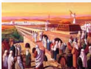
שריפת פרה אדומה בהר המשחה

האם יש להמתין לביאת המשיח? במשנה מבואר, שממיות עזרא נעשו שבע פרות אדומות - "ומי עשאן? שמעון הצדיק ויוחנן כהן גדול... וישמעאל בן פיאני" (מסכת פרה ג,ה). הרמב"ם מוסיף - "העשירית יעשה המלך המשיח - מהרה יגלה" (פרה ג,ד). אין לכך מקור בדברי חז"ל ולמעשה קובע הרמב"ם באיגרת השמד, ש"חייב המצוות אינו תלוי בביאת המשיח! אלא אנחנו מחוייבים להתעסק במצוות, ונשתדל להשלים עשייתן" - ואחר כך יבוא משיח.