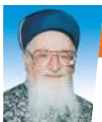
מפסקי הראש"ל הרב מרדכי אליהו שליט"א ערוך מתוך הספר: שו"ת הרב הראשי

לאחר שברכנו על המצווה שבלימוד תורה, וגם על ההנאה מהלימוד, לא נותר לנו אל לשבח את הקב"ה על כך שבחר