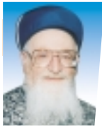
מפסיק הראש"ל הרב מרדכי אליה שליט"א רשם: הרב שמואל זעפרני